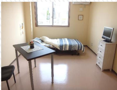
居室 (スタンダード)